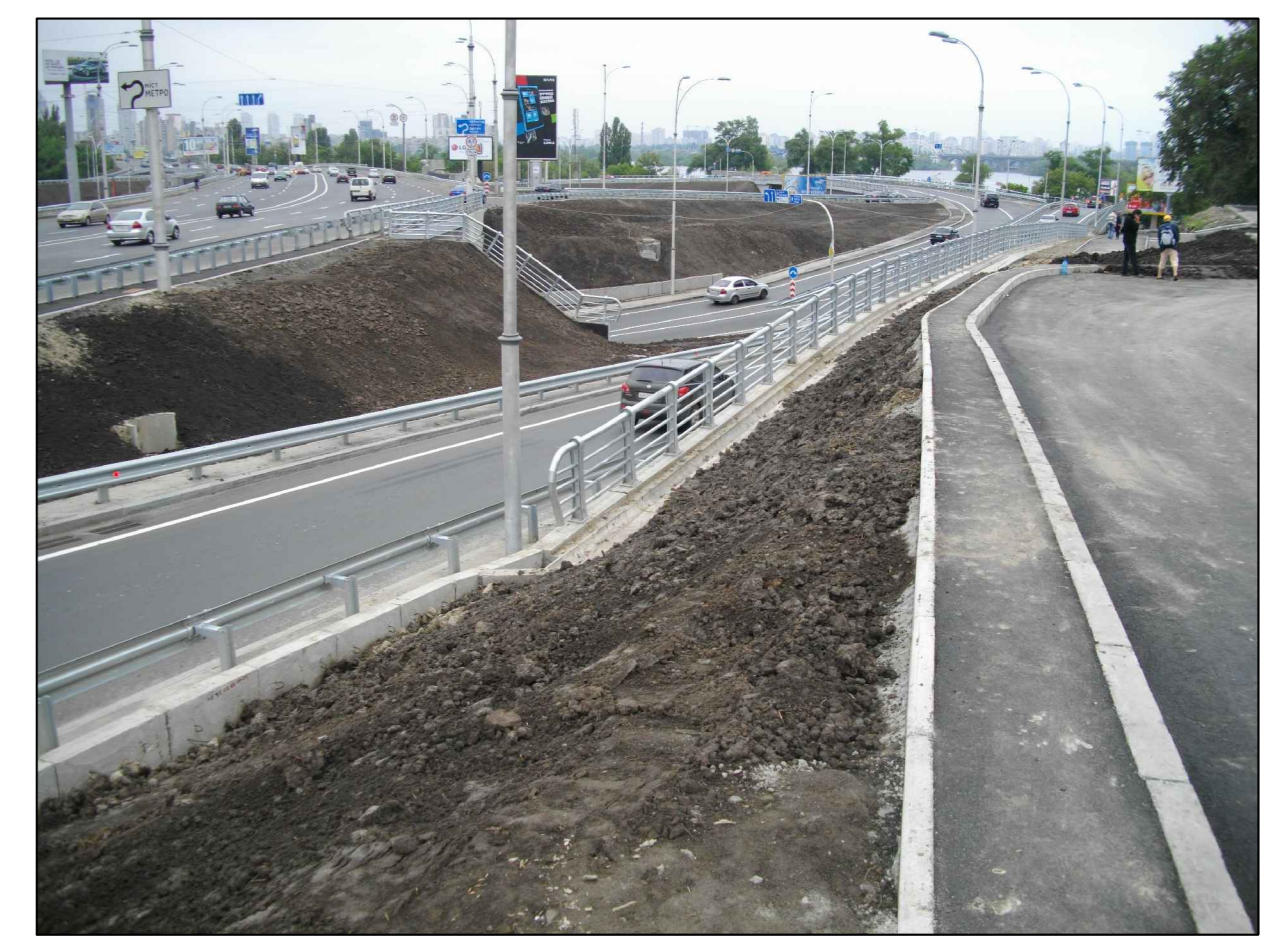
Фотофіксація (точка 2)

рух транспорту по Набережному та Наддніпрянському шосе