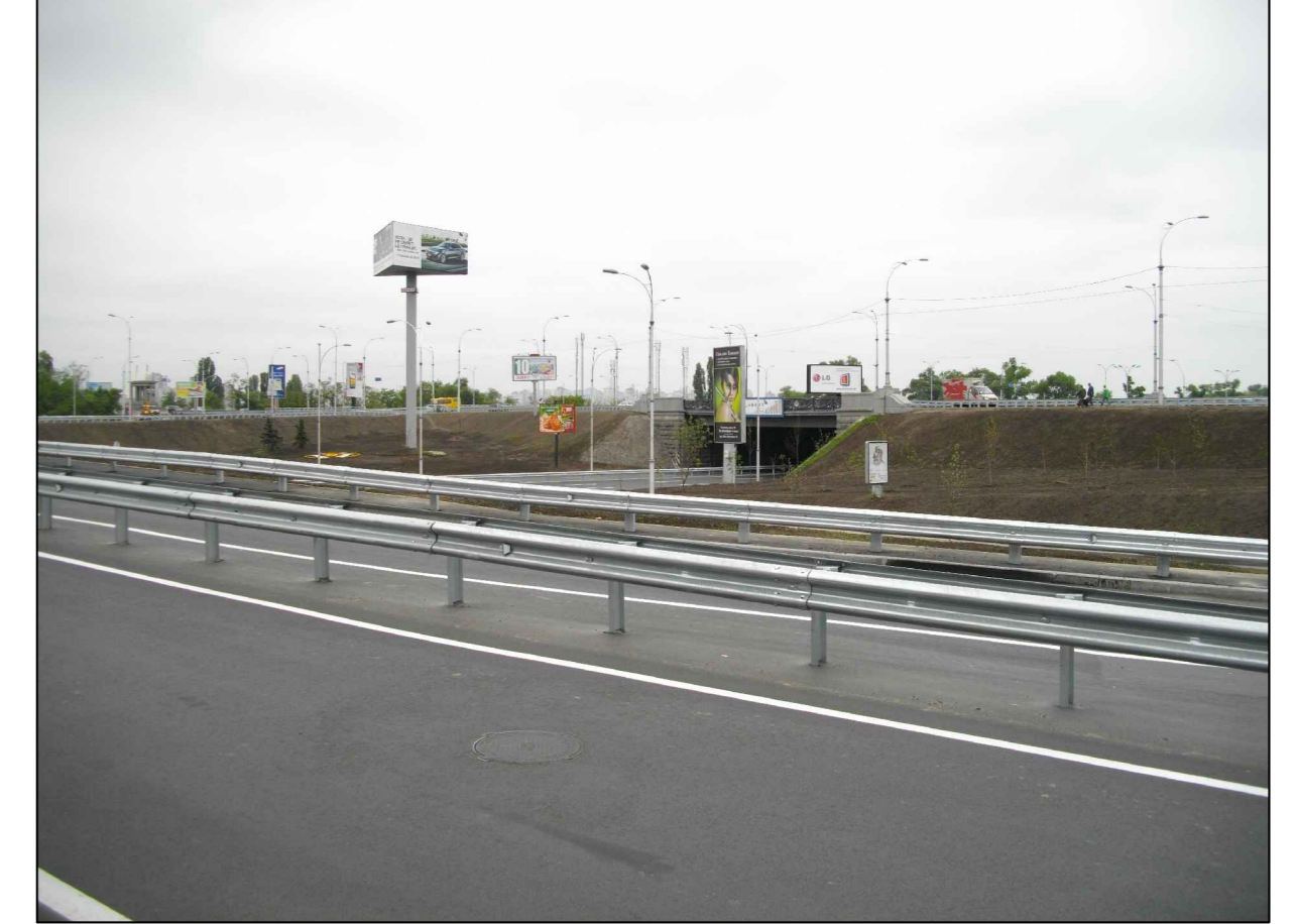
Фотофіксація (точка 1)